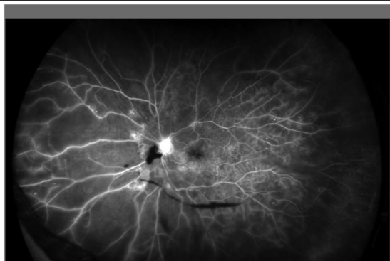
増殖性糖尿病網膜症 (FA)